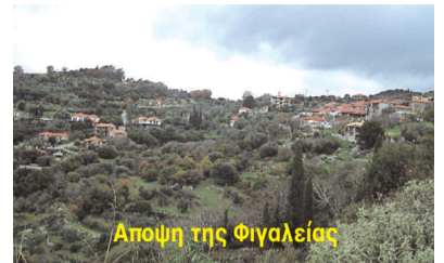
Αποψη της Φιγαλείας

ΟΡΓΑΝΟ ΤΟΥ ΣΥΛΛΟΓΟΥ ΤΩΝ ΑΠΑΝΤΑΧΟΥ ΦΙΓΑΛΕΩΝ " Ο ΦΙΓΑΛΟΣ"