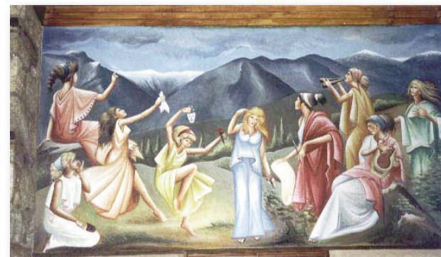
Ο χορός των Μουσών

Ωσάν την αύρα έρχεται, δροσιά για να μας φέρει, Ας καίει η λαύρα δυνατά, ας είναι Καλοκαίρι. Μα ρίχνει και τους κεραυνούς, εκεί όπου ταιριάζει, Ας είναι καταμεσήμερο και οι ουρανοί γαλάζιοι!! Διονύσιος Θεοχάρης