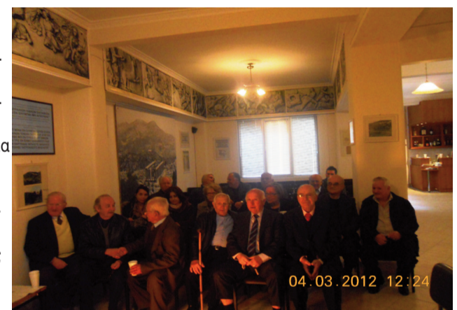
Φωτο από τη γενική συνέλευση

- Ο δικός μας Ιστορικός Εκπολιτιστικός Σύλλογος, παρότι δεν μπορεί παρά να επηρεάζεται από αυτό το δύσκολο και επικίνδυνο περιβάλλον, αντιστέκεται σθεναρά στην πορεία φθοράς και αποσύνθεσης, χάρις στις προσπάθειες όλων των μέχρι σήμερα μελών των Διοικητικών Συμβουλιών ( Δ.Σ.) του Συλλόγου μας και τη δική σας ενεργό συμμετοχή και συμπάρασταση, αγαπητοί Συμπατριώτες και Συμπατριώτισσες, όπου Γης, Φιγαλείς. Για αυτό το λόγω στηριζόμενος στην αγάπη των μελών και των φίλων του και με τη βοήθεια της Θεϊκής Πρόνοιας, ο Σύλλογός μας, ξεπέρασε ήδη τα 50 χρόνια προσφοράς και δημιουργίας. Είναι όμως απαραίτητο να αναζητήσουμε τον τρόπο που θα έλθουν κοντά στο Σύλλογο οι νέοι μας, αλλά και όσο το δυνατόν και άλλα μέλη, έτσι ώστε να τον στελεχώσουν & να τον στηρίξουν με φρέσκιες και σύγχρονες ιδέες και δράσεις και να του δώσουν ελπίδα και προοπτική για περαιτέρω εδραίωση και ανάπτυξη.