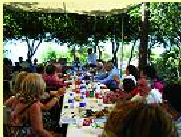
ζωή στο χώρο και θα αναβιώσουμε παλιές και αξεχάστες μέρες και εποχές. Ας αδράξουμε την ευκαιρία.

Στις 20 Ιουλίου το πρωί, μας αναμένει η κορυφή του Αϊ ΛΙΑ, όπου όλοι μαζί με κέφι και ελπίδα θα δώσουμε